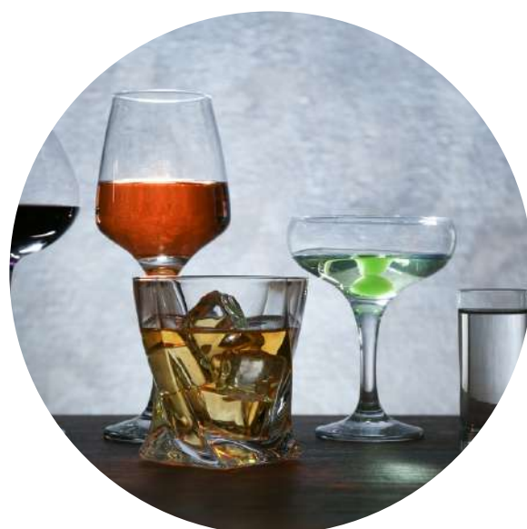
Wine and spirits